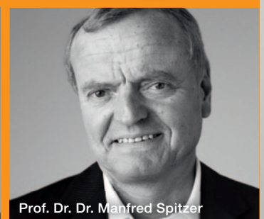
Prof. Dr. Dr. Manfred Spitzer