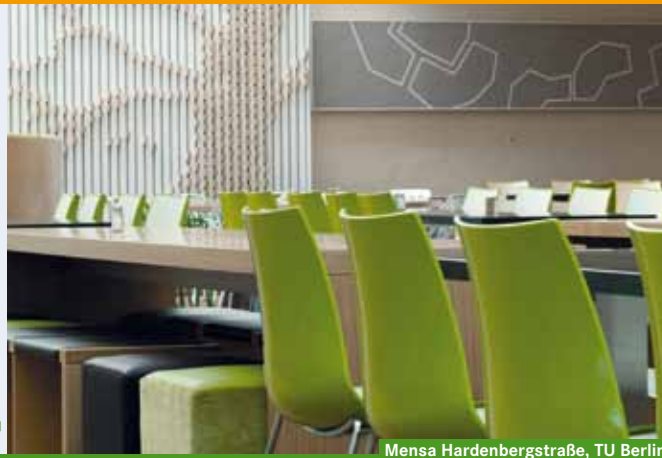
Mensa Hardenbergstraße, TU Berlin