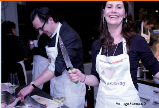
Vintage Genuss Schule